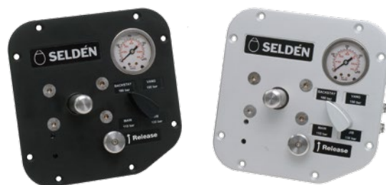
Centrale, 4 fonctions