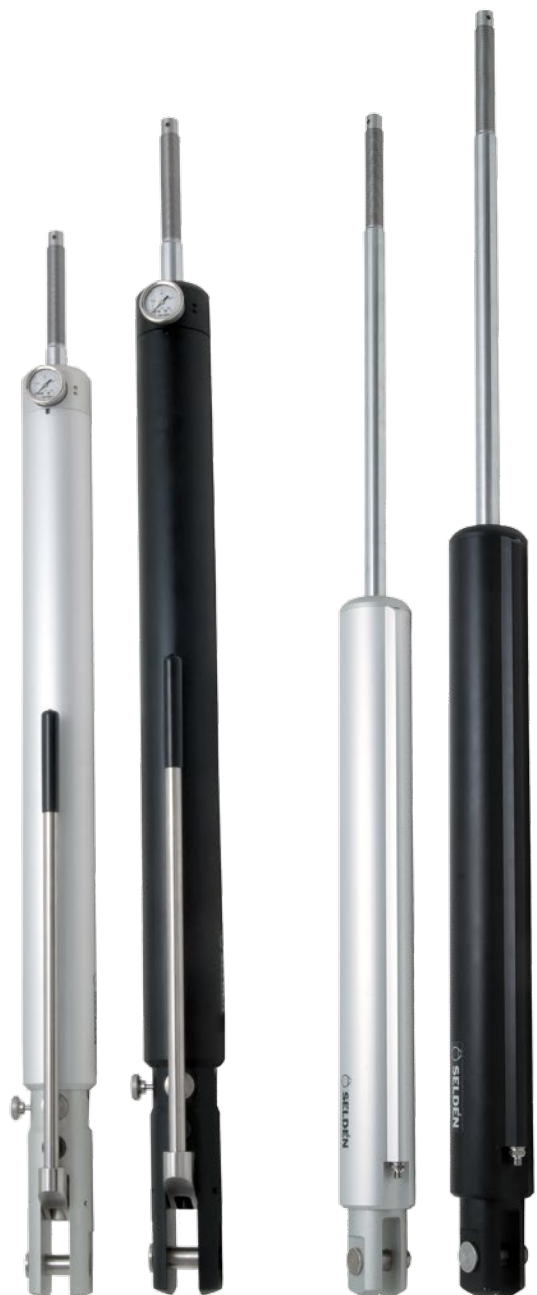
Vérins hydrauliques de pataras avec pompe intégrée (HTI).