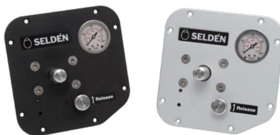
Centrale, fonction unique