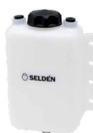
Réservoir à huile, Réf. N° 585-300-01