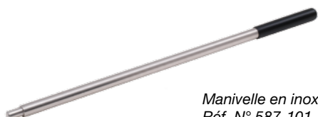
Manivelle en inox, Réf. N° 587-101, Ø20 x 500 mm