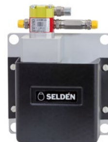
Pompe électrique, Réf. N° 507-800-01